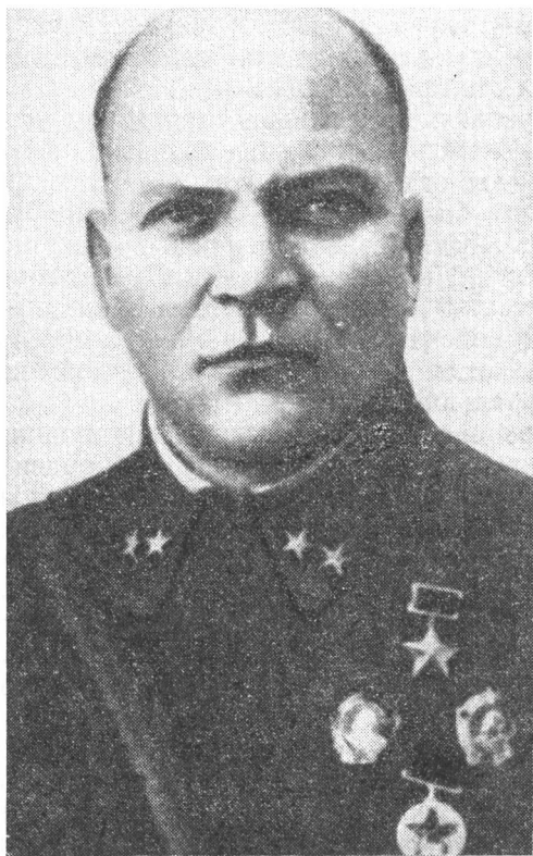
Герой Советского Союза Александр Ильич Лизюков